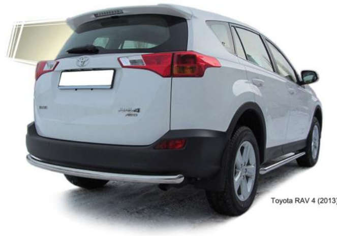
Toyota RAV 4 (2013)