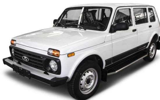
Общий вид автомобиля с порогом

Перед установкой изделия необходимо убедиться, что автомобиль, на который планируется установка, соответствует модельному ряду, указанному в настоящей инструкции. В случае затруднений с определением соответствия обращайтесь службу технической поддержки supp@rivalauto.com . В случае наезда на препятствие необходимо убедиться в отсутствии повреждений и агрегатов автомобиля и пригодности дальнейшей эксплуатации порогов. При правильной установке пороги не должны касаться узлов и агрегатов автомобиля. Производитель вправе вносить изменения в конструкцию порогов.