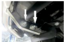
Рис. 3 - Установка защиты