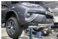
Рис. 4 - Общий вид автомобиля с защитой