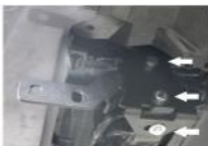
Рис. 2 - Установка кронштейнов