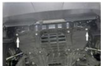
Рис. 1 - Установка фиксируемых гаек