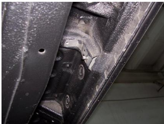
Рис. 2 Место крепления