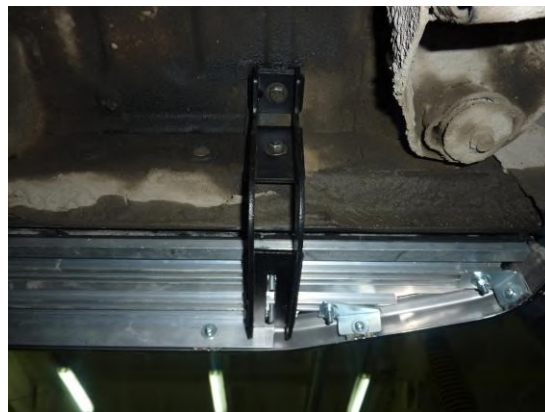
Рис. 3 Установка кронштейна