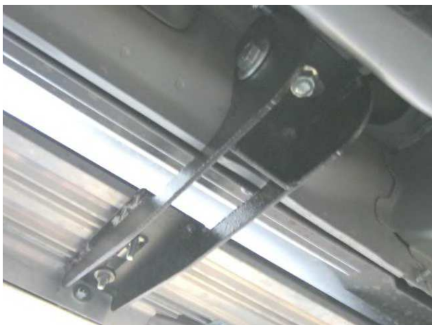
Рис. 2 Передний кронштейн