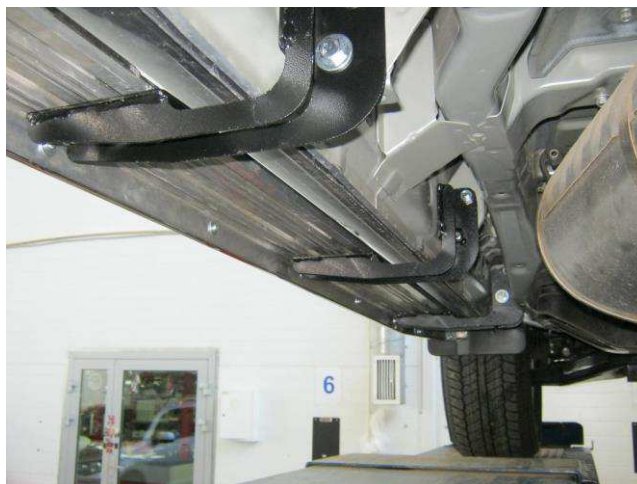
Рис. 5 Общий вид установленных кронштейнов