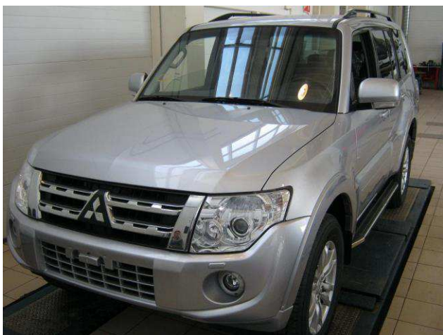
Рис. 6 Вид автомобиля с порогом