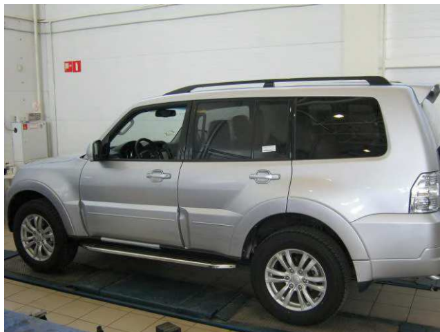
Рис. 7 Вид автомобиля с порогом