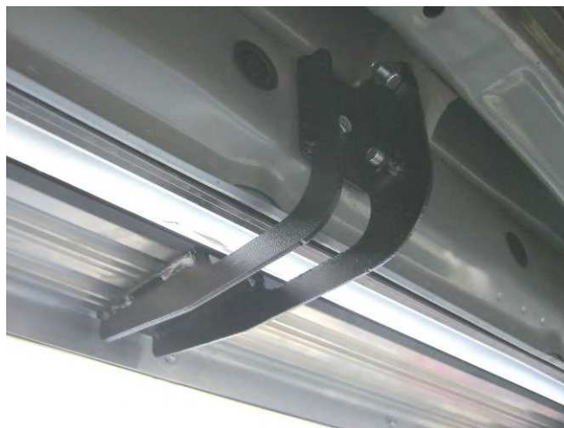
Рис. 3 Средний кронштейн