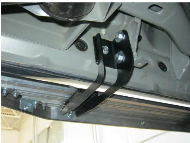
Рис. 4 Задний кронштейн