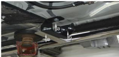
Рис. 2 Установка заднего кронштейна