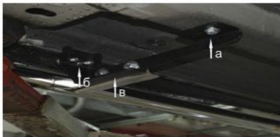
Рис. 1 Установка переднего кронштейна