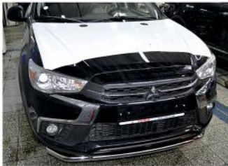
Рис. 3 - Общий вид автомобиля с защитой