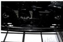
Рис. 2 - Установка защиты