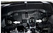
Рис. 1 - Установка кронштейнов