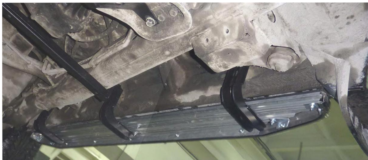
Рис. 4 Вид установленных кронштейнов