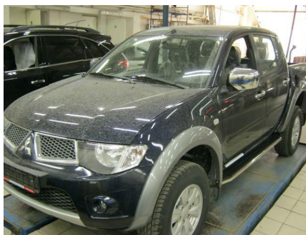
Рис. 7 Вид автомобиля L200 с порогом