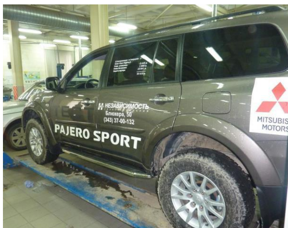
Рис. 6 Вид автомобиля Pajero Sport с порогом