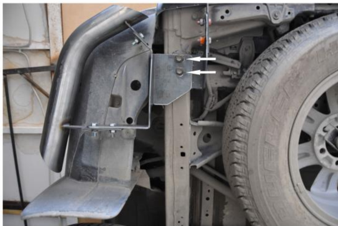
Рис. 1 Установка левого кронштейна