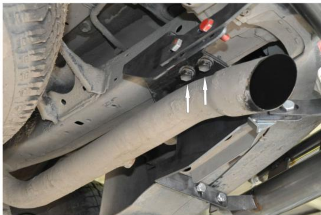
Рис. 2 Установка правого кронштейна