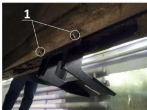
Рис.3 Установка кронштейна