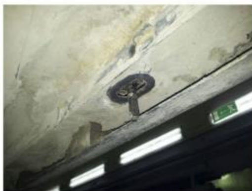
Рис.2 Установка шпильки закладной M10