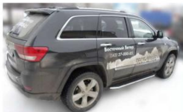
Рис.4 Вид автомобиля с порогом