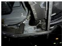
Рис. 5 - Место установки заднего кронштейна