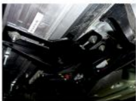
Рис. 6 - Установка заднего кронштейна