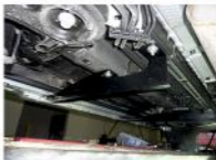
Рис. 2 - Установка переднего кронштейна