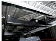
Рис. 4 - Установка среднего кронштейна