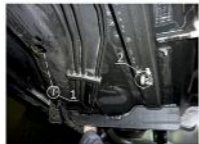
Рис. 3 - Место установки среднего кронштейна