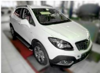
Рис. 7 - Общий вид автомобиля с порогом