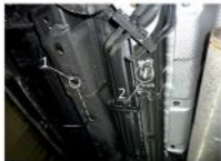
Рис. 1 - Место установки переднего кронштейна