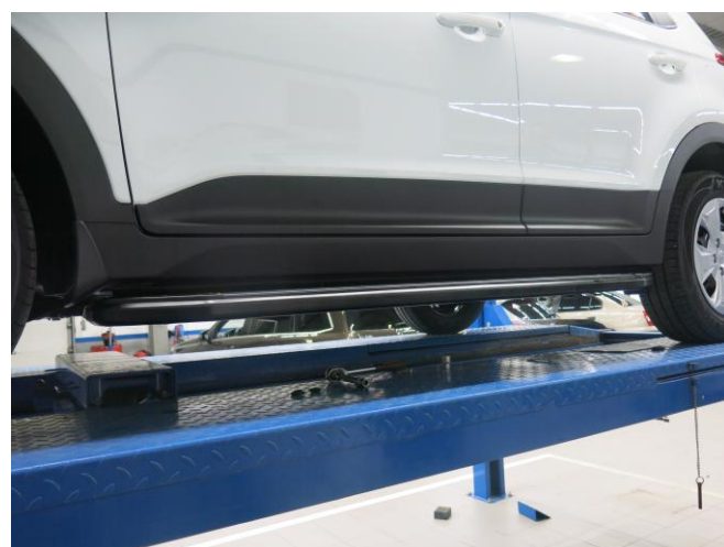
Общий вид автомобиля с порогами