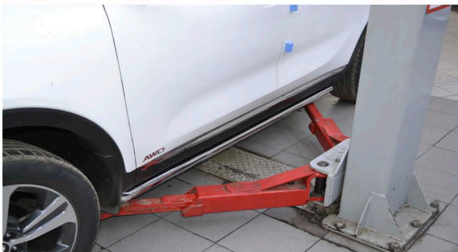
Общий вид автомобиля с защитой порога

Перед установкой изделия необходимо убедиться, что автомобиль, на который планируется установка, соответствует модельному ряду, указанному в настоящей инструкции. В случае затруднений с определением соответствия обращайтесь службу технической поддержки supp@rivalauto.com . В случае наезда на препятствие необходимо убедиться в отсутствии повреждений и агрегатов автомобиля и пригодности дальнейшей эксплуатации защиты порогов. При правильной установке защита порогов не должна касаться узлов и агрегатов автомобиля. Производитель вправе вносить изменения в конструкцию защиты порогов.